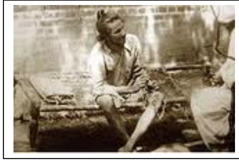
'விடியல்' மாத இதழ்

பின்னர் பகத்சிங் அவர்களை நோக்கித் தாங்கள் கைதுக்குத் தயாராக இருப்பதாகவும், தங்களிடம் ஆயுதங்கள் இல்லையெனவும் உறுதியளித்த பின்னரே அக்