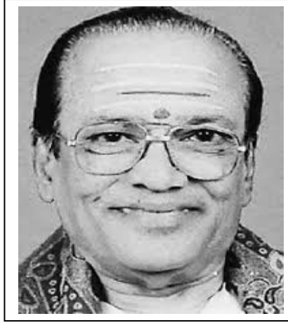
‘விடியல்’ மாத இதழ்

வீரம், காதல், சோகம், துள்ளல், தத்துவம், நையாண்டி மற்றும் கிராமிய மணம் கமழும் பத்தாயிரத்துக்கும் மேற்பட்ட திரைப்படப் பாடல்களையும், 2500-க்கு மேற்பட்ட பக்திப் பாடல்களையும் பாடியுள்ளார். இன்றைய முன்னணி திரைப்பட நட்சத்திரங்களான ரஜினிகாந்த் மற்றும் கமல்ஹாசன் ஆகியவர்களுக்கும் பாடியுள்ளார்.