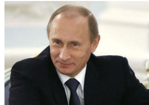
விளாடிமிர் புடின் (Владимир Путин), ரஸ்ய அதிபர்: ஜெர்மன், ரஷ்யன், ஆங்கிலம் ஆகிய

இங்கிலாந்து பிரதமர்: டச்சு, ஜெர்மன், பிரெஞ்சு, ஸ்பானிஷ், ஆங்கிலம் ஆகிய ஐந்து மொழிகளில் உரையாடும் ஆற்றல் பெற்றவர். இவரது தாய் டச்சு மொழி பேசுபவர், மனைவி ஸ்பானிஷ் மொழி பேசுபவர். எதிர்காலத்தில் பன்னாட்டு உறவுகளுக்கும், வாணிபத்திற்கும் பன்மொழிப்புலமை அவசியம் என இளைய தலைமுறைகளிடன் தொடர்ந்து வலியுறுத்தி வருகிறார். "ஒருவருடன் (ஏதோ) ஒரு மொழியில் பேசும்போது நீங்கள் சொல்லும் கருத்து அவரது மூளைக்குச் செல்கிறது, ஆனால் அதை அவரது (தாய்) மொழியில் சொல்லும்போது அக்கருத்து அவரது இதயத்திற்குப் போகிறது" என்னும் நெல்சன் மண்டேலாவின் மொழிச் சிந்தனையோடு ஒன்றிணைந்தவர்.