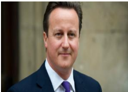
டேவிட் கேமரூன் (David Cameron),

ஆங்கிலப்பலமை முன்னாள் பிரெஞ்சு அதிபர் நிக்கோலஸ் சர்கோசியை விட சிறப்பாக இருந்தாலும், பிரான்ஸ் கடைபிடித்துவரும் "பிரெஞ்சு அதிபர் பிரெஞ்சு மொழியில் தான் பேச வேண்டும்" என்பதில் உறுதியாக இருக்கிறார். 2012 இல் ஓபாமாவுடனான சந்திப்பில், மொழிபெயர்ப்பாளர் உதவியுடன் முழு உரையாடலையும் பிரெஞ்சில் தான் நிகழ்த்தினார். இறுதியில் ஒரு நகைச்சுவை துணுக்கை மட்டும் ஆங்கிலத்தில் கூறினார். அப்போது ஓபாமாவின் முகம் மிகவும் பிரகாசமானதுமதே போன்று அமெரிக்க தேர்தலில் இரண்டாவது முறையாக வென்ற ஓபாமவிற்கு 2012இல் அனுப்பிய வாழ்த்து மடல் முழுமையாக பிரெஞ்சு மொழியில் தான் இருந்தது. ஆனால் இறுதியில் friendly என்றே ஆங்கிலத்தில் எழுதி கையெழுத்து இட்டார்.